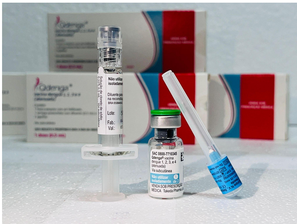
Figura 03 - Vacina dengue tetravalente

A vacina dengue tetravalente (atenuada) do laboratório Takeda foi autorizada para uso no Brasil em março de 2023 pela Agência Nacional de Vigilância Sanitária (Anvisa). Essa vacina foi introduzida no Sistema Único de Saúde (SUS) em dezembro de 2023, após uma rigorosa avaliação da sua eficácia, segurança e custo-efetividade - Figura 03