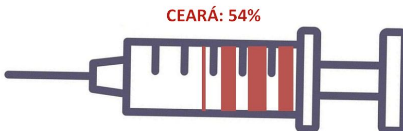
Figura 1 - Cobertura Vacinal, Influenza, Ceará, 2023

Conforme dados do painel do Ministério da Saúde (LocalizaSUS), o Estado do Ceará finalizou a campanha nacional de vacinação contra influenza com 54% (1.311.846/2.437.775) de cobertura vacinal nos grupos prioritários (crianças, gestantes, puérperas, idosos, trabalhador de saúde, indígenas, professores), um resultado acima da média do país de 44%. No ranking entre as unidades federadas, o estado ocupou o 3º lugar em doses em doses aplicadas no grupo de crianças e o 6º lugar em Cobertura Vacinal nos grupos prioritários (Figura 01).