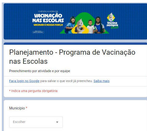
Figura 1 - Formulário para informação do planejamento da estratégia de vacinação nas escolas